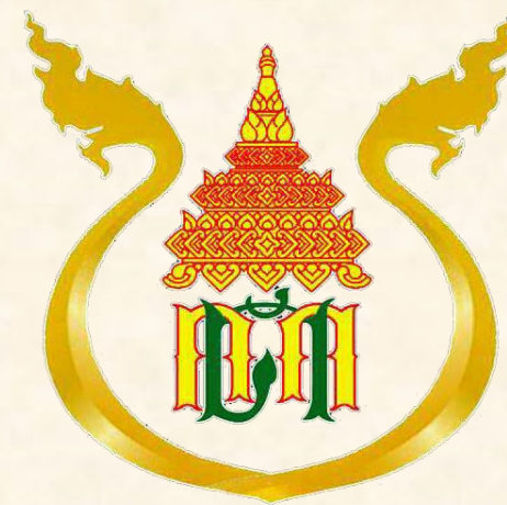
ด้านศุลกากรหนองคาย

ตั้งแต่นายด่านฯ มารับหน้าที่ เมื่อวันที่ 29 กันยายน 2559 - ปัจจุบัน มีผลการจับกุมยาเสพติด จำนวน 41 คดี